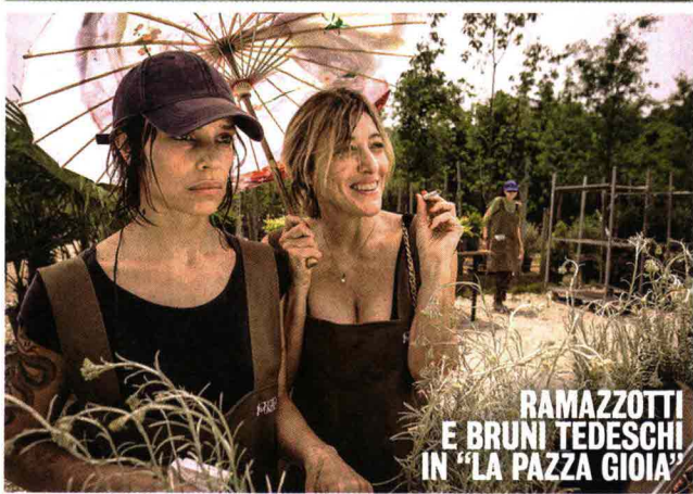
RAMAZZOTTI E BRUNI TEDESCHI IN "LA PAZZA GIOIA"