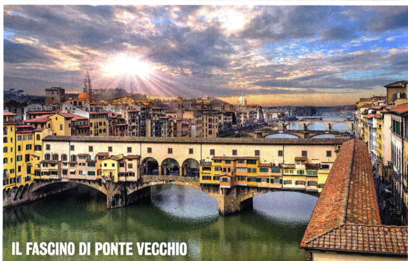
IL FASCINO DI PONTE VECCHIO