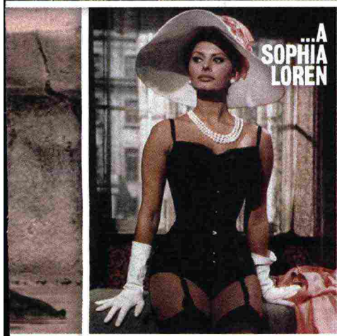
...A SOPHIA LOREN

(Mimesis, € 18). Qual è la funzione dei miti? Che ruolo hanno le immagini, l'immaginario nella società moderna? A queste domande cerca di dare una risposta Gilbert Durand in questo libro sui rapporti tra miti e società.