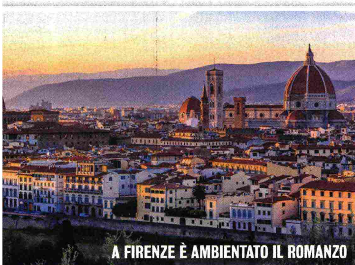
A FIRENZE È AMBIENTATO IL ROMANZO

TRA FICTION E LIBRI A sin., Firenze, dove è ambientato il nuovo libro di Antonella Borealevi "Magnifica creatura" (La nave di Teseo, € 19). Nella pagina a fianco, nelle due foto piccole, ecco proprio la scrittrice e la cover del libro che racconta gli anni del boom economico, tra il 1951 e il 1967. Sono anche gli anni che fanno da sfondo a tanti film e serie tv come "L'amica geniale" (più a sin., Margherita Mazzucco, 19 anni, e la bruna Gaia Girace, 18). Sotto, a sin., Sophia Loren, 87, simbolo di quegli anni e, più a sin., Marcello Mastroianni (1924-1996) e Anita Ekberg (1931-2015) in "La dolce vita" (1960). Ancora più a sin., in basso, Neva Leoni, 29, in "Il paradiso delle signore".