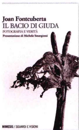
Il bacio di Giuda , di Joan Fontcuberta, 184 pagg., 40 ill. in b/n, Mimesis, € 16.

una raccolta di saggi, resta potentemente attuale, anche perché, scrive Michele Smargiassi , «la sua proposta è la critica non del visuale in sé, ma delle sue intenzioni», che oggi più che mai, nell'era della Furia delle immagini (sempre Fontcuberta, Einaudi 2018) è fondamentale saper praticare. L'importante è tenere a mente che la macchina fotografica, «prezioso strumento per negoziare con il mondo», non va sopravvalutata né idealizzata. La capacità – o meno – di avvicinarsi al reale non è del mezzo, ma di chi lo usa e di come lo fa.