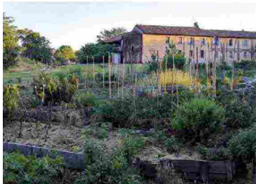
Immagini dalla scorsa edizione di "Cascine Aperte"