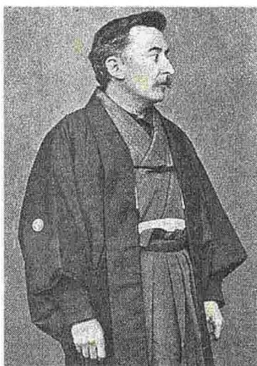
Lafcadio Hearn: nato in Grecia, morì a Tokyo