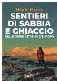
Nick Hunt, Sentieri di sabbia e ghiaccio nelle terre estreme d'Europa , Mimesis, 336 pagine, 20 €

Un lembo di tundra artica in Scozia; le foreste al confine fra Polonia e Bielorussia; i canyon rocciosi di Tabernas, in Spagna, l'unico deserto geograficamente considerato tale nel vecchio continente; le steppe dell'Ungheria. Quattro esplorazioni in altrettanti habitat insoliti e inaspettati d'Europa diventano "piccoli pellegrinaggi nell'immaginazione", occasioni per testimoniare l'insospettata ricchezza del nostro "giardino di casa".