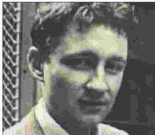
Guy Debord

si è allontanato in una rappresentazione. È già il Debord che si basa sui testi di Hegel e di Marx utilizzando quello che sarà un marchio di fabbrica, il détournement , ossia una riscrittura creativa. Scrive: “Lo spettacolo non è un insieme di immagini ma un rapporto sociale fra individui mediato dalle immagini”. Jappe fa i conti con la biografia di un uomo misterioso ed inaccessibile come pochi. In un certo senso, un avventuriero. Con la sua prosa scintillante e