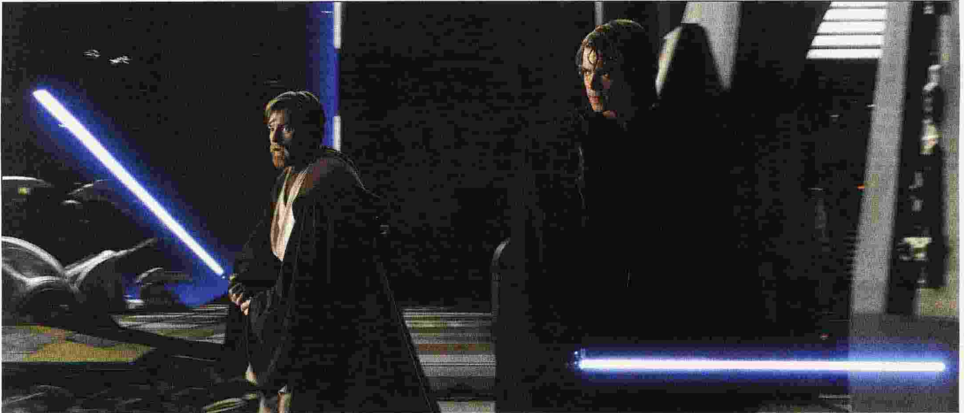
Obi-Wan Kenobi (interpretato da Ewan McGregor) e Anakin Skywalker (interpretato da Hayden Christensen) in 'Star Wars: Episodio III - La vendetta dei Sith', capitolo della saga di George Lucas uscito nel 2005