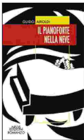
IL PIANOFORTE NELLA NEVE Autore: Guido Airoldi Editrice: Neos pp. 112 € 14

Un gruppo di giovani di buona famiglia, freschi di diploma trascorre qualche giorno in una baita di alta montagna in compagnia di un pianoforte. Musica e chiacchierate sono nel programma alternandole alle sciate nella neve fresca. Ma la nebbia è in agguato. I sette partono ugualmente, solo sei di loro però fanno ritorno: il settimo verrà ritrovato con una profonda ferita mortale al polso. Al suicidio non crede nessuno, ma neanche l'incidente convince, quindi gli stessi ragazzi avviano le loro indagini. Nel paesaggio dell'alta montagna il thriller serve all'autore per parlare dell'amicizia giovanile e delle sue increspature.