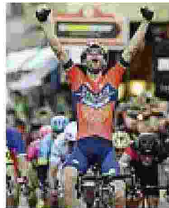
Ciclismo Vincenzo Nibali