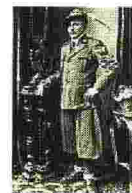
Alpino In divisa